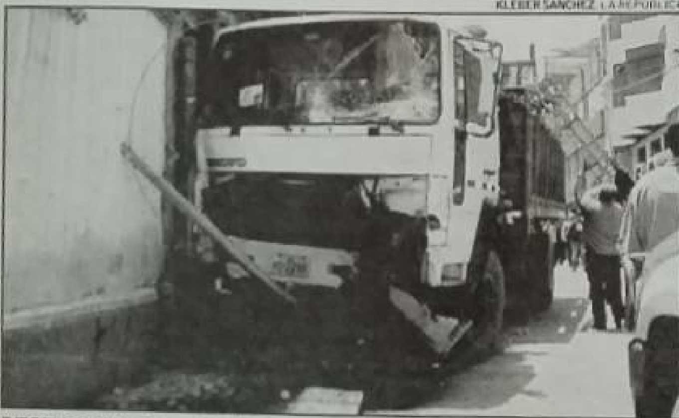
DESTROZOS. El camión de Electro Sur terminó empotrado en una pared.