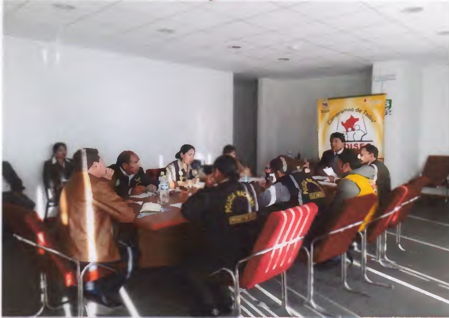
Sexta Sesión Ordinaria del Comité Distrital de Seguridad Ciudadana de Socabaya 2017, realizada el día Miércoles 28 de Junio del 2017