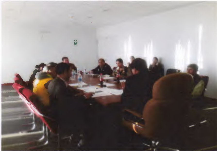
Fotografía N° 02